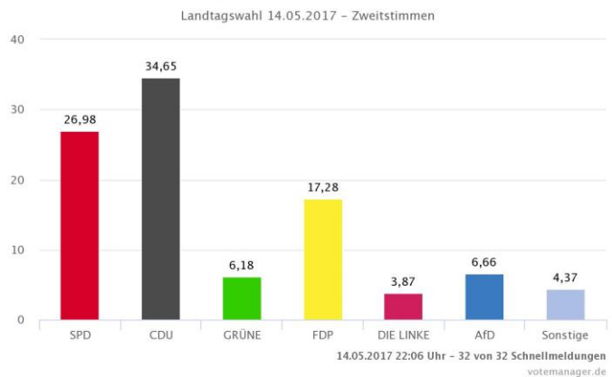
Stadt Leichlingen (Rheinland) – Gesamtergebnis